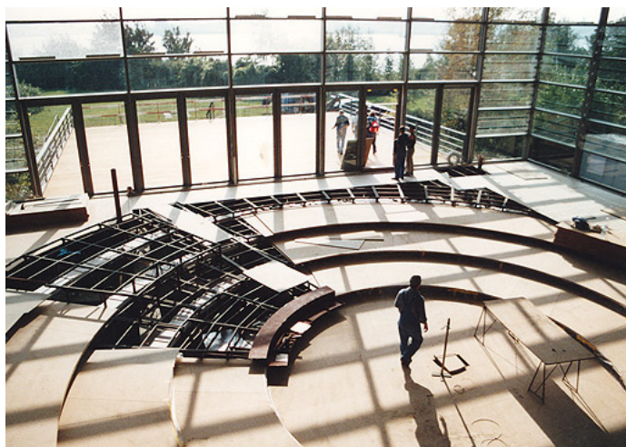
In Zukunft soll es weniger Sitze im Landtag geben.

Teile des Antrags, wie die zukünftige Anwendung des Sainte-Laguë Sitzteilungsvorgangs, sowie der Vollausschleich der Überhangmandate werden von uns begrüßt, dem Antrag als Ganzes konnten wir allerdings nicht