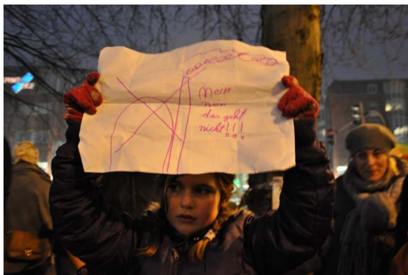
Junge Demonstrantin auf der Kieler Mahnwache für Fukushima am 14.3.2011