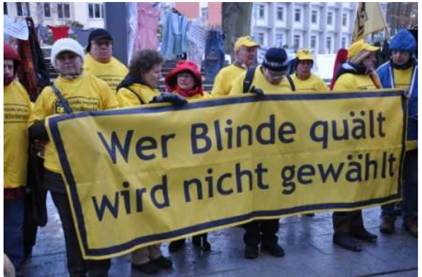
Die Blinden- und Sehbehinderten demonstrieren gegen menschenfeindliche Politik.

und Sozialanträge stehen wir gerne zu Verfügung, denn man wird nun genau beobachten müssen welche gravierenden Veränderungen die Kürzungen in der Realität zu Tage treten lassen.