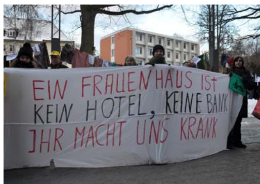
Frauenprotest gegen Kürzungen, 15.12.2010