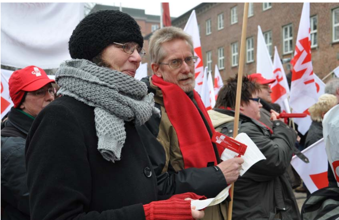
Die Fraktion DIE LINKE unterstützt die Gewerkschaften im Kampf um gerechte Löhne