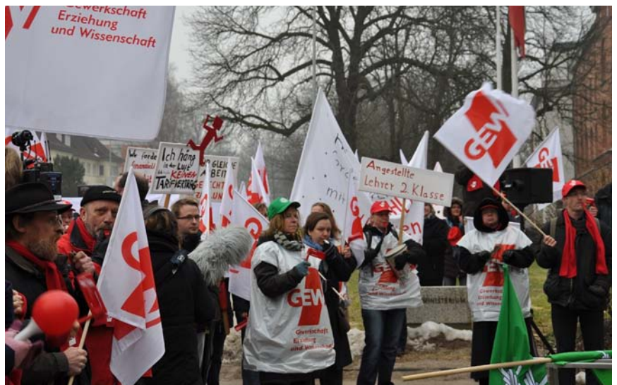
Demo für gerechten Lohn im öffentlichen Dienst vor dem Landtag

Positiv hervorzuheben ist, dass die Zusammenarbeit von Partei und Fraktion bei diesem Antrag gut funktioniert hat. Auf der Straße vor Betrieben standen am Aktionstag Mitglieder und verteilten Flyer gegen die Leiharbeit an Beschäftigte.