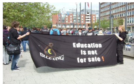
SchülerInnenstreik in Kiel 2010