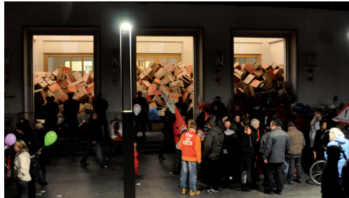
Das Bündnis Gerecht geht anders wirft der Landesregierung am 18.11.2010 ihr „Sparpaket“ vor die Tür.

DIE LINKE steht für eine Finanzpolitik, die den Menschen und seine Bedürfnisse in den Mittelpunkt stellt und die Kommune als unmittelbaren Lebensraum stärkt. In wichtige Zukunftsfelder, wie zum Beispiel die Bildung, muss investiert werden, um langfristig unnötige Folgekosten zu vermeiden. Insgesamt fordert DIE LINKE eine deutliche Verbesserung der Einnahmenseite und eine konsequent soziale Ausrichtung auf der Ausgabenseite.